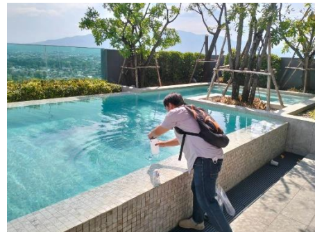
ภาพที่ 3-3 เก็บตัวอย่างคุณภาพน้ำจากสระว่ายน้ำบริเวณน้ำในสระว่ายน้ำจากฝัวน้ำสระ