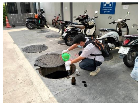
ภาพที่ 3-1 เก็บตัวอย่างคุณภาพน้ำทิ้งบริเวณน้ำทิ้งก่อนเข้าระบบ