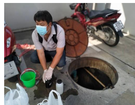
ภาพที่ 3-2 เก็บตัวอย่างคุณภาพน้ำทิ้งบริเวณน้ำจากบ่อกักน้ำสุดท้ายก่อนระบายออกระบบระบายน้ำทิ้งสาธารณะ